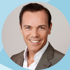
Gerhard Pichler Business Circle